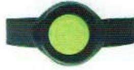
Le détecteur de chute